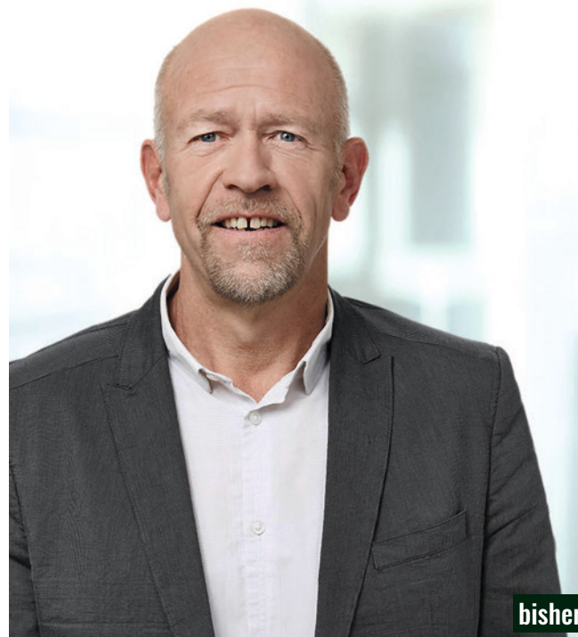
Als Burgdorfer liegt mir die Stadt sehr am Herzen. Burgdorf ist auf einem fortschrittlichen Weg. Ich will mithelfen, das Boot zu steuern und die Segel weiterhin im richtigen Wind zu halten.

Burgdorf soll für Unternehmen attraktiv sein, damit auch Arbeitsplätze und Wohnen möglichst nah beieinander sind.